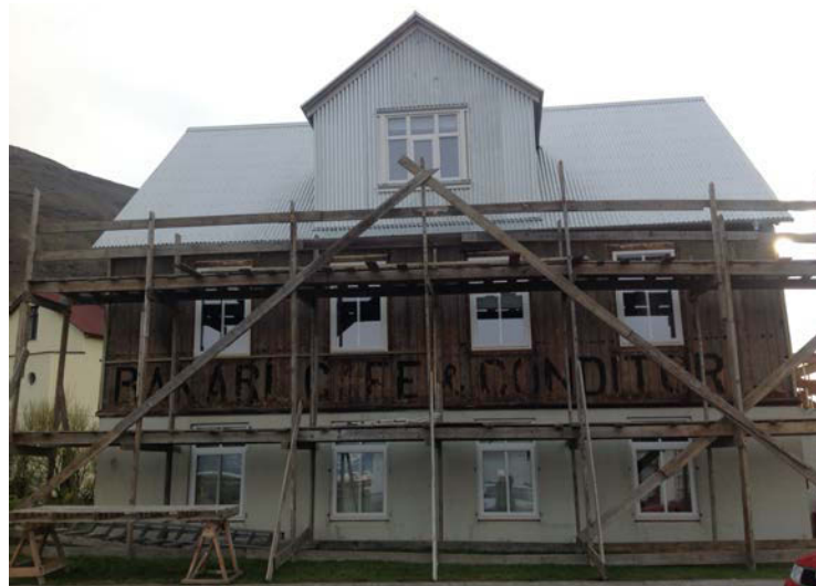
Þeir hafa greinilega kunnað til verka í kynningarmálum á Þingeyri í þá daga.